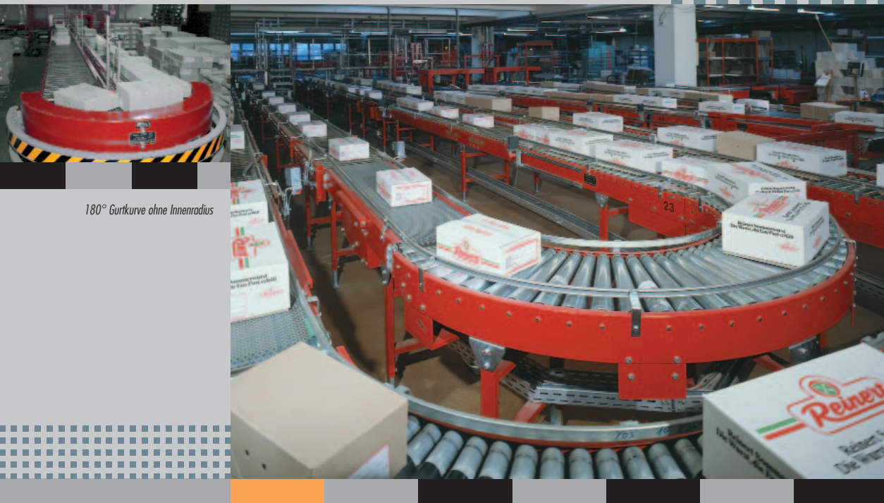
180° Gurtkurve ohne Innenradius