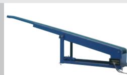
Teleskopgurtförderer zum Be- und Entladen von LKW's