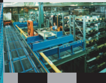
Palettenfördertechnik für Euro-, Gitterbox-, Stahl- und Sonderpaletten